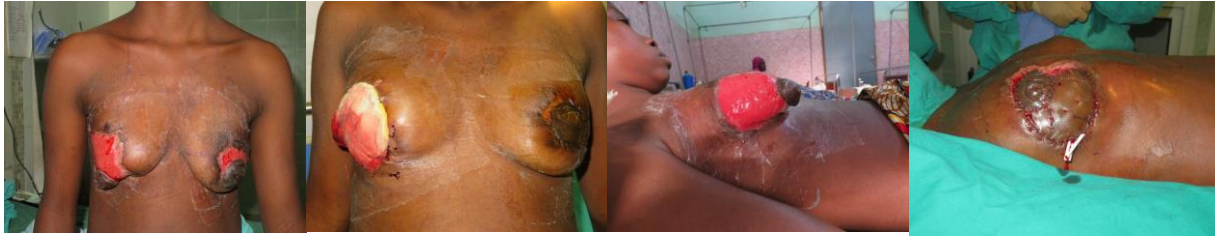
Patiente de 30 ans avec dermo-hypodermite des deux seins traitée par mastopexie et greffes.