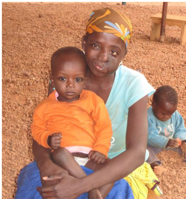
Patiente opérée en 2007, venue avec sa fille pour un remodelage de son lambeau