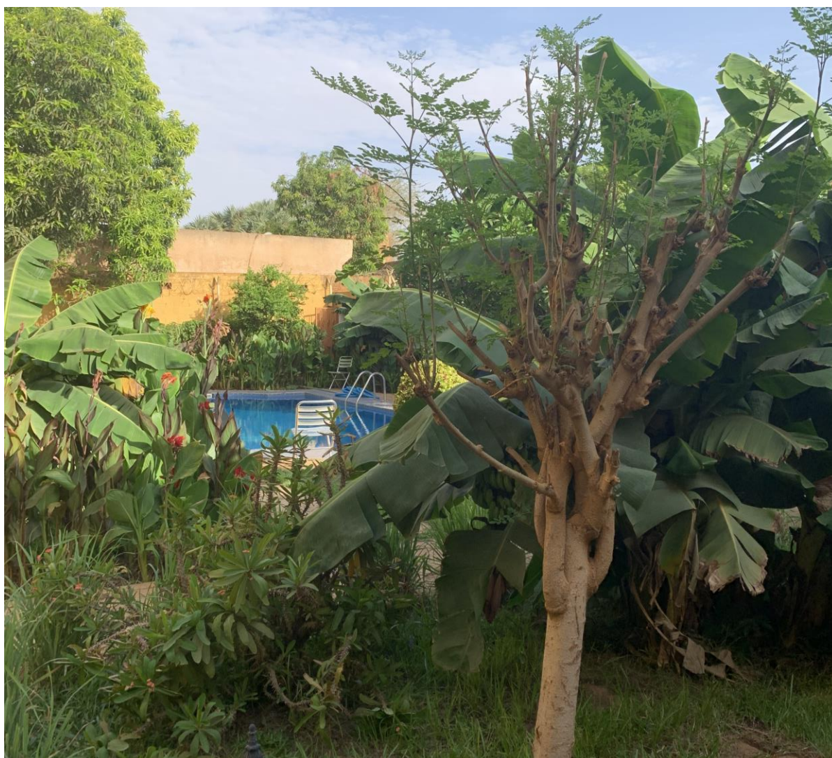
Genève, 12 juin 2023

Ce bilan très positif nous amène à considérer que de prochaines missions, dans ces conditions de sécurité, sont envisageables, toujours sous l'égide de HilfAktion et Interplast.